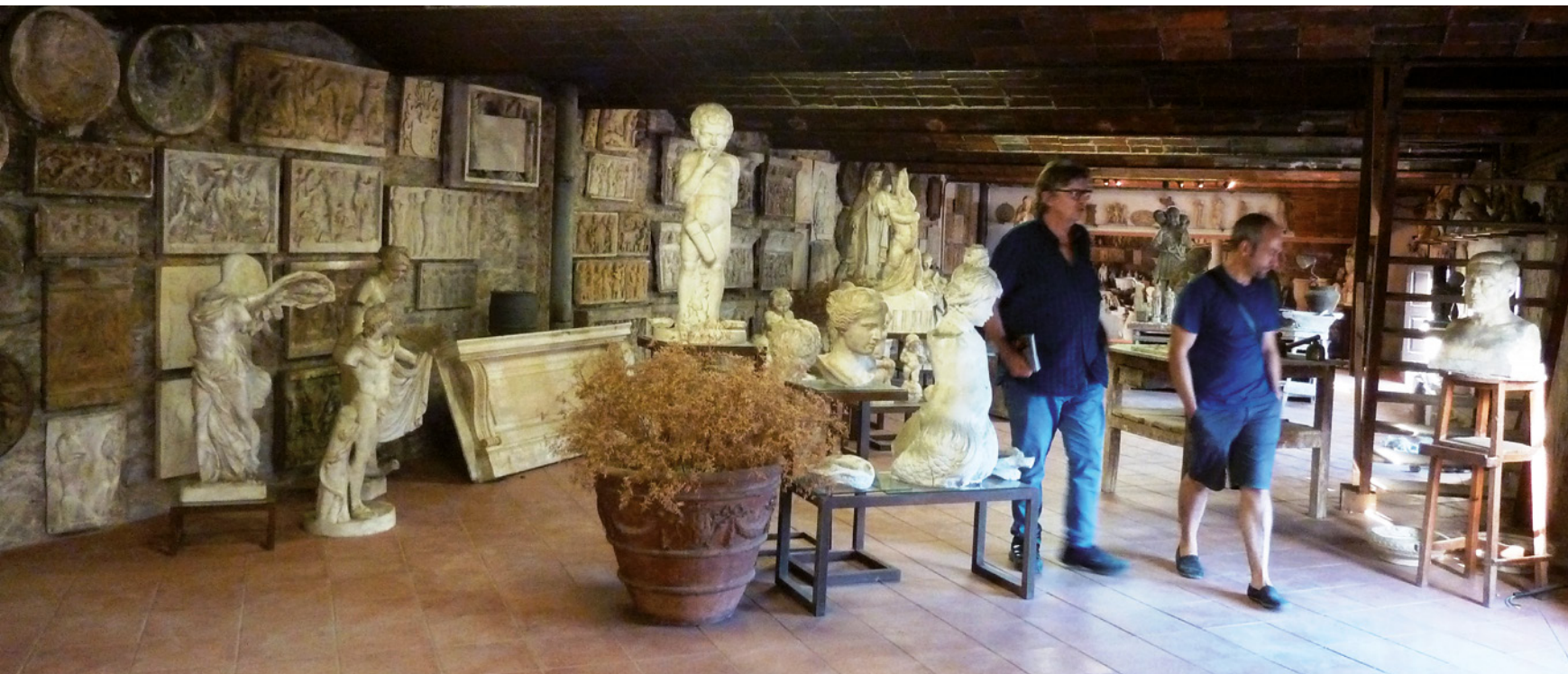
Fig. 4. Obrador de Ceràmiques Marcó. Imatges obtingudes durant la visita amb motiu del Congrés de l'Acadèmia, el dia 17.09.16