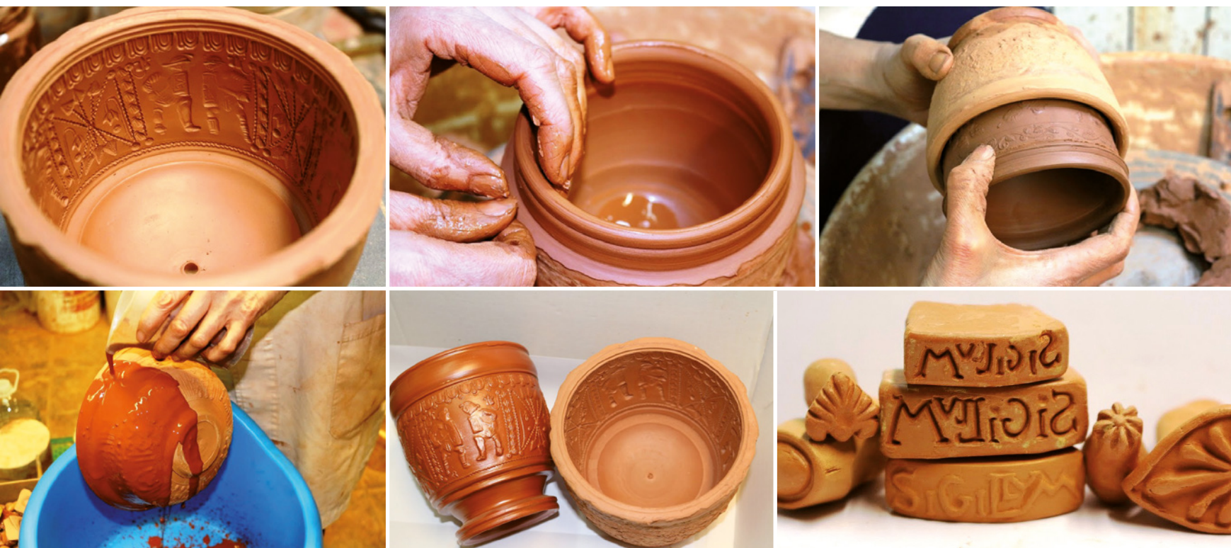
Figura 2. Procés de reproducció de ceràmiques antigues.

venir-hi de la manera més rigorosa possible. En el cas de restitució dels elements ceràmics, habitualment es reproduïxen amb fidelitat les tècniques primigènies d'acord amb uns criteris preestablerts, ben valorats segons les particularitats de cada cas.