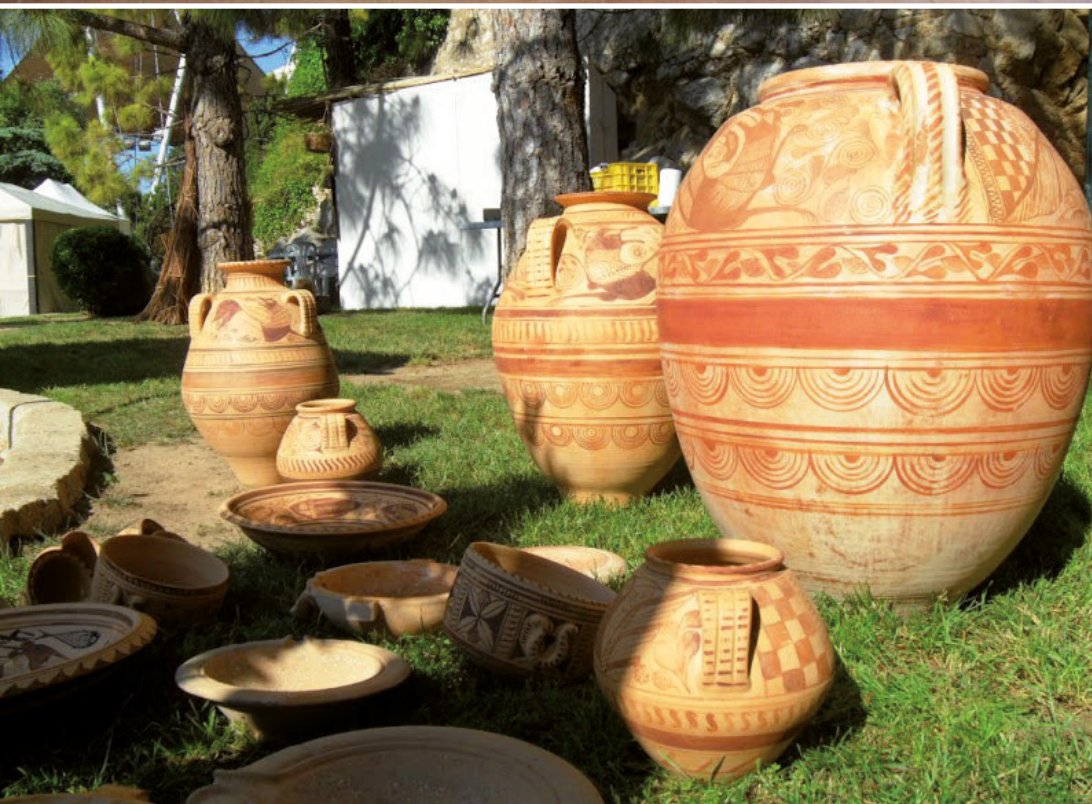
Figura 5. Reproduccions de ceràmiques ibèriques del taller de Carmen Herce.

neracional (d'avis a néts), tot passant de pares a fills, almenys des de l'any 1473, segons les fonts documentals conservades en els arxius de la Corona d'Aragó i de la Confraria dels Ollers de Quart.